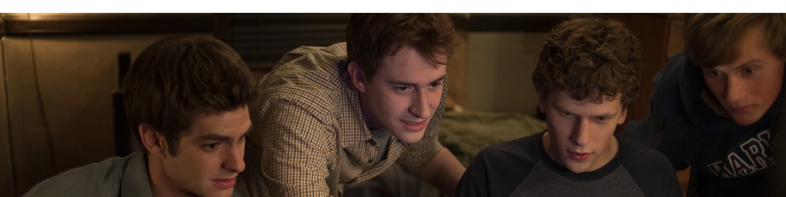
Från: The Social Network, Sony Pictures